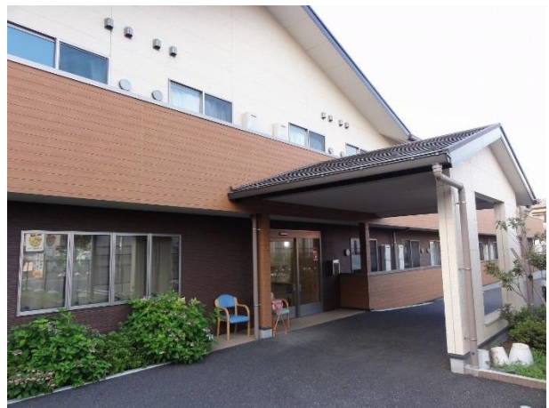
ピュアリーフ大宮 外観