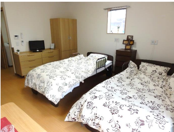
ピュアリーフ大宮 夫婦入居可能居室

「ピュアリーフ」シリーズの居室は 25 平方メートル以上の広さがあり、居室内に浴室、トイレ、ミニキッチンを備えています。「ピュアリーフ大宮」の 24 室中 3 室は、さらに広い 35.51 平方メートルの夫婦で入居できる居室があります。