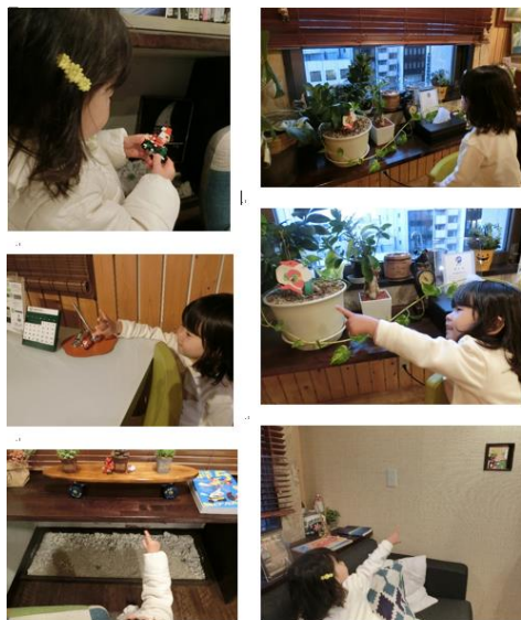
富士企画 子供がサンタクロースを探す様子

本イベントは富士企画が 2015 年から毎年 12 月に開催しています。顧客の不動産投資家や取引関係者、その家族にも参加してもらい、「物件探しではなく、サンタ探しに来てください」をキャッチフレーズに、オフィス内に隠した小さなサンタクロースの人形を見つけるゲームです。全部見つけた方にはプレゼントを提供。年々サンタクロースの数を増やしています。