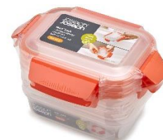
ネストロック 3ピースセット オレンジ 540ml