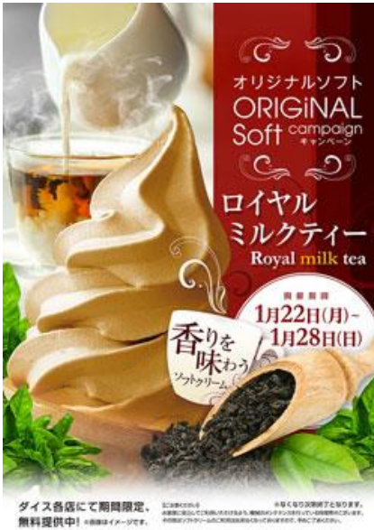
【ロイヤルミルクティー】