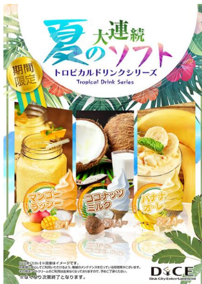
【マンゴーラッシー・ココナッツミルク・バナナオレ 3種】