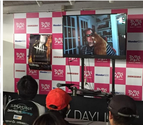
▲愛猫の登場で会場の雰囲気がさらに和やかになりました