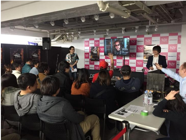
▲マシュー氏との交流に日本のファンも大喜び