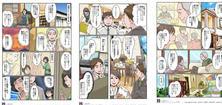
3ページで読みやすくしました

※1 日本ホームステージング協会では、快適な住まいと暮らしを実現するための様々な問題を専門知識と技術で解決することで、住まいの価値や暮らしの質を高めることをホームステージングと定義しています。