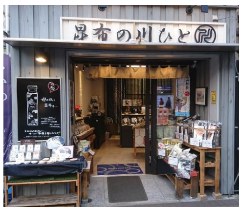
昆布の川ひと浅草本店

■ URL : http://www.office-web.jp/kawahito/