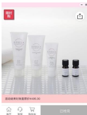
左：微信商品紹介ページ