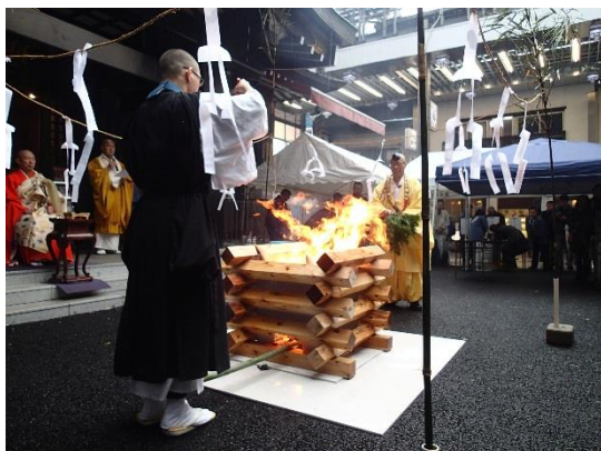
昇龍焚き上げの様子