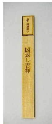
凶返し吉祥護摩木