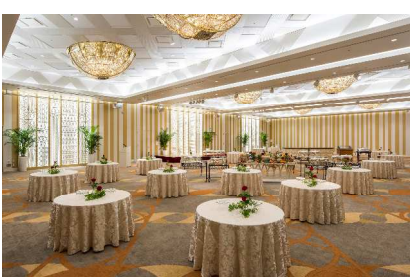
大宴会場「マグノリアホール」