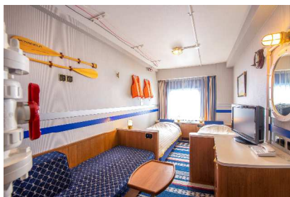
クルージングキャビン3