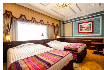
エンプレスルーム