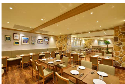
オールデイダイニング「カリフォルニア」