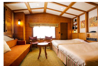
マウンテンルーム