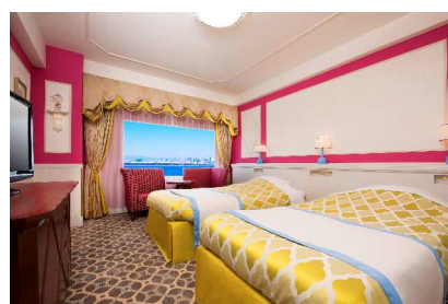
キャッスルルーム