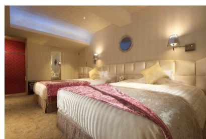
ブライズ&プリンセススイート