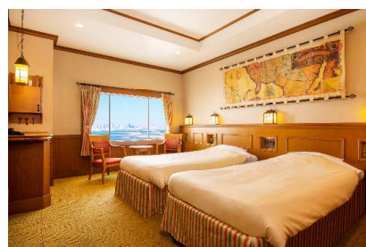
フロンティアルーム