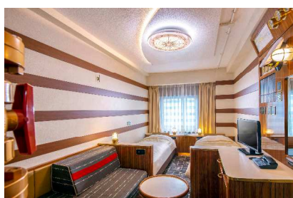
キャプテンズルーム