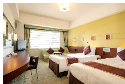
プレジァールーム・プレミアム