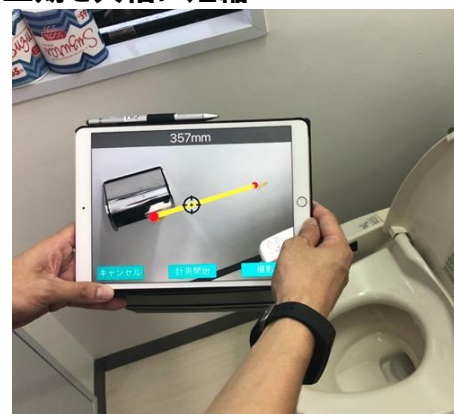
見積アプリ『FUS II』による手すりの設置

独自開発のビジネスモデル「介護リフォーム支援システム」（特許第6222945号）は、見積作成や介護保険の申請書類の作成などの事務作業を一括で管理できるクラウドシステムを構築し、介護事業者や施工業者との円滑でスピーディな連携を実現しました。