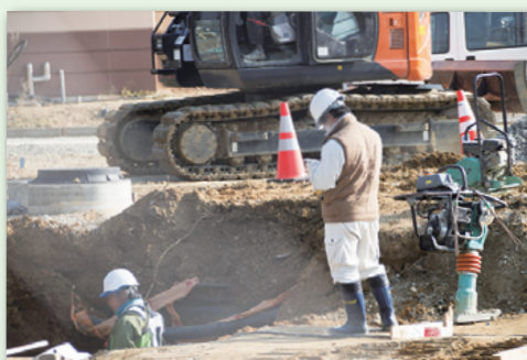
建設・土木の現場で