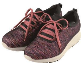
＜レディース／コーラル系＞