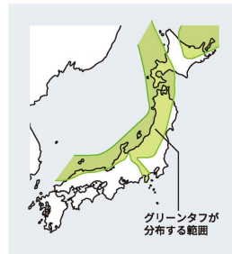
■ 日本のグリーンタフの分布

グリーンタフは日本海側の広い範囲とフォッサマグナという凹地で認められる（地盤上で太平洋側に伸びる緑色の帯）。グリーンタフ堆積当時の日本列島は東西に分かれていたようだ（『図説地学』をもとに作成）