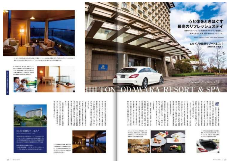
紙面特集：ヒルトン小田原リゾート&スパ