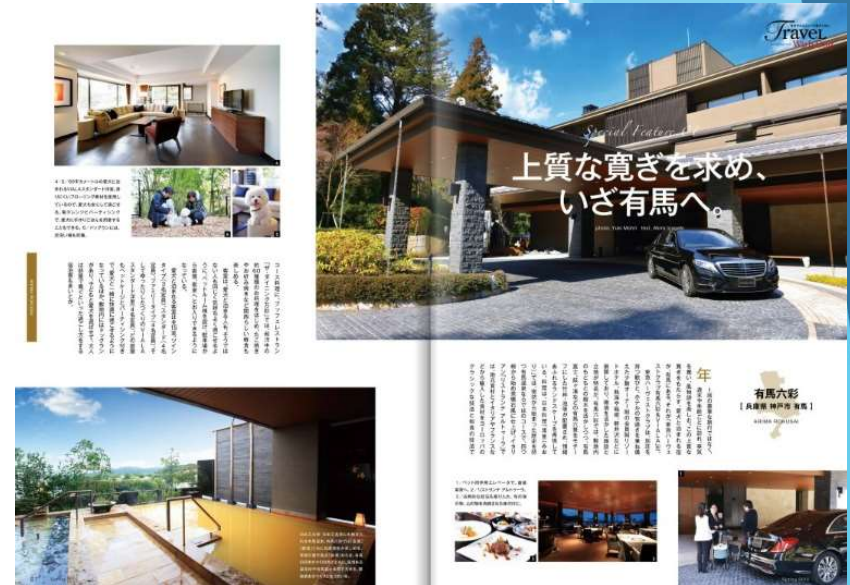
紙面特集：東急ハーベスト 有馬六彩