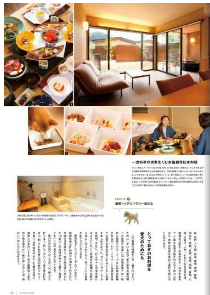
紙面特集：レジーナ・リゾート箱根