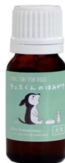
『チェスくんのはみがき』外箱とボトル