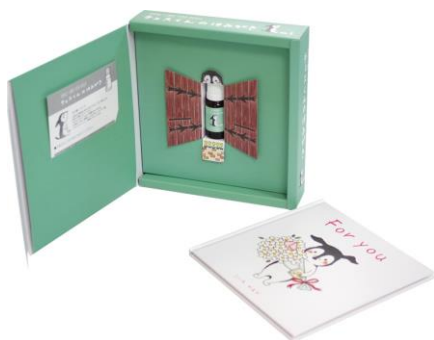
イラスト集つき初回限定パッケージ

パッケージに描かれた「チェスくん」は、イラストレーター小彩楓氏による子犬のキャラクターです。初回限定版には、絵本形式のかわいいイラスト集がついており、愛犬家の方へのプレゼントとしても最適です。また、製品のために制作されたプロモーションムービーでは、チェスくんのイラストに元宝塚雪組の透水さらさ氏の歌を乗せ、愛犬のオーラルケアと口内菌質管理を啓発しています。