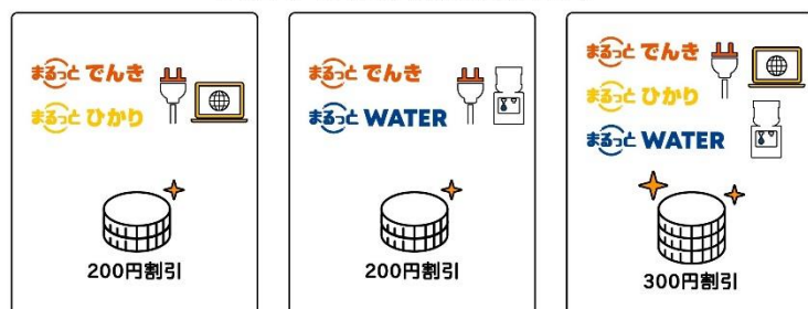
ライフスタイルに合わせた自由な組み合わせ