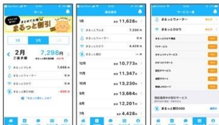
『まるっとポータルアプリ』画面例