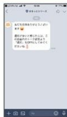
LINEでいつでもお問い合わせができます