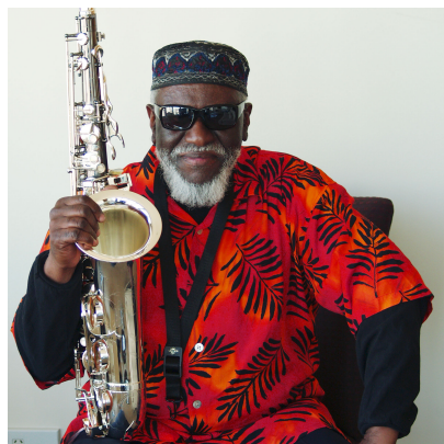
ファラオ・サンダース

2019年からは東京・日本橋三井ホールをメイン・ステージとして装いも新たに開催！ 話題の最新スポットをどのような音楽が彩るのか・・・詳細は5月の第一弾発表を楽しみにしてほしい。