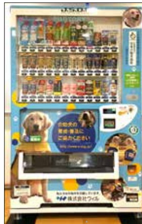
▲介助犬支援自動販売機設置 1本につき3～7円を、日本 介助犬協会に寄付