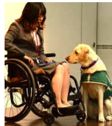
▲全社員の前で、兵庫介助犬協会の職員と PR 犬によりデモンストレーションを実施してもらい、介助犬への理解を促進。 (2018年4月撮影)

▲関係者と当社新入社員(2018 年 4 月撮影)。新入社員は、入社初日に、自社の社会貢献活動について理解を深めます。