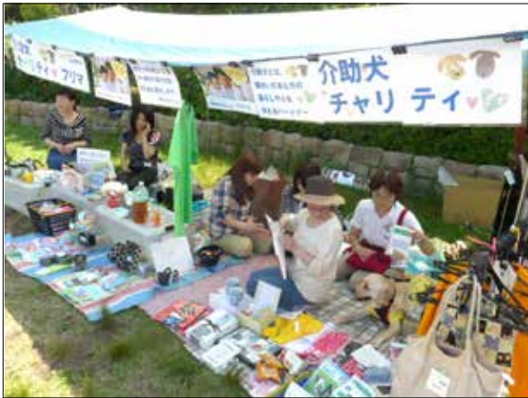
▲介助犬チャリティフリーマーケットの開催 売上げの一部を寄付