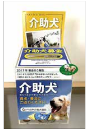
▲全拠点に募金箱を設置 定期的に日本介助犬協会 へ送金

上記以外にも、全拠点に補助犬入店許可ステッカーを貼付、自社ウェブサイトに関係するウェブサイトへのリンクボタンを設置、社員の名刺に介助犬応援マークを印刷する等を行っています。 社会貢献活動を一部業務としてではなく、社員一人一人がその意識を持ち、「ささやかを続けよう！」を合言葉に、できることを続けていこうと考えております。