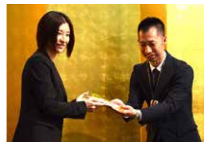
▲兵庫介助犬協会理事長(右)に、契約募金を贈呈する当社代表(左)。(2018 年 4 月撮影)