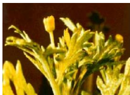
ゴールデンカモミール（タナクリス）

本品の成分中である「パッションフルーツエキス（キュアパッション）」は、むくみを改善する効果が期待されています。顔のマッサージをすることにより、体内の老廃物を排出するリンパ節を刺激し、流れをよくし、むくみを改善します。