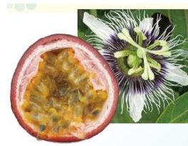
パッションフルーツ（キュアパッション）

「ゴールデンカモミール（タナクリス）」の成分に含まれるビタミン P は、血行を促進する働きがあります。顔のマッサージを行うに伴い代謝促進が期待できます。