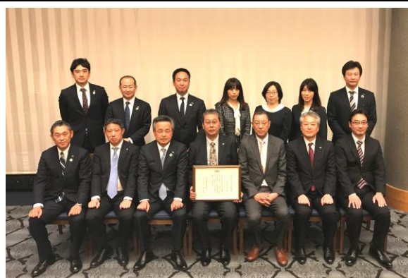
認証式後にスタッフで記念撮影

当社はこれからも、リース・販売から保険まで広範なサービスを提供する物流業界に強いファイナンス会社として、多くのお客様に喜ばれるサービスを提供いたします。