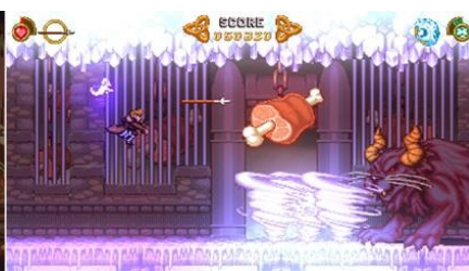
▲ボスラッシュプレイ画面