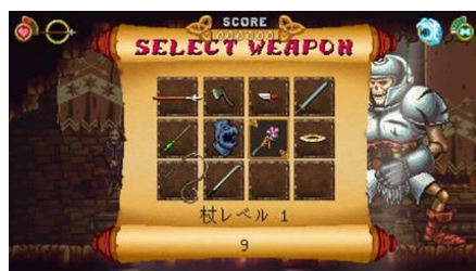
▲ボスラッシュの武器セレクト画面

【アーケードモードのアップデート】2つの新モード『ボスラッシュ』と『国王の冒険』が追加