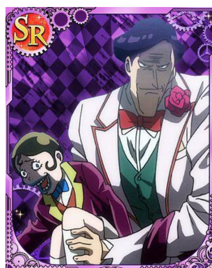
[どちらも本体] パウルマン&アンゼルス