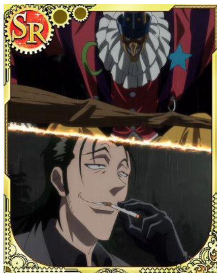
[ぶっ殺し組のリーダー] 阿紫花英良&プルチネルラ