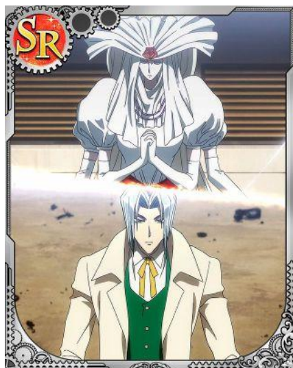
[シェイクスピア曰く…] ギイ&オリンピア