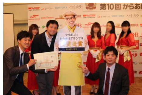
第 10 回からあげグランプリ授賞式

「からあげグランプリ」は、日本唐揚げ協会が開催し、今年で第10回を迎える、全国の唐揚げ店を決める人気投票企画です。地域、調理法、タレの味などによって、全11部門に分かれており、投票によって各部門の最高金賞受賞店 1 店、金賞受賞店複数店が決まります。