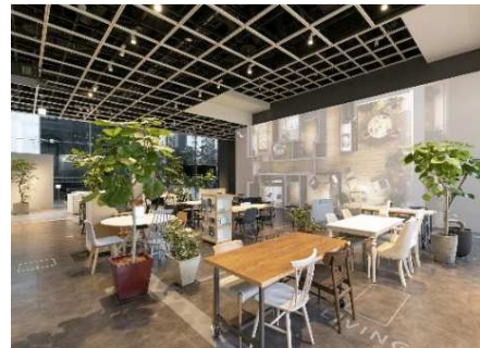
セミナー会場となるラウンジ