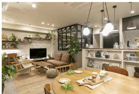
リノベ体感できるリアルサイズモデルズ