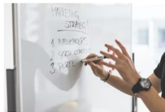
社内広報 プロモーション