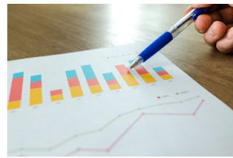
分析 レポートニング