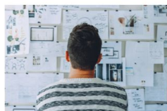
カルチャー、社員特性に 適した制度設計

リファラルパートナーズ ～あなたの会社に適した“社員がファンになる”リファラル採用を～