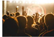
ファン化定着支援