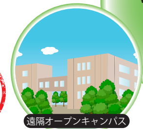
遠隔オープンキャンパス