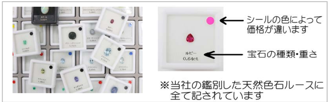
↑ 当社で販売している天然色石ルース