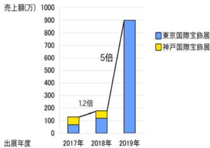
国際宝飾展総売上額(約) ※東京・神戸を含む

今回の神戸国際宝飾展では、過去の国際宝飾展(東京・神戸)で販売してきた数を上回る 当社史上最多の天然色石ルース15,000石を展示販売 します。色石ルースを取り扱っている出展社は約20社ありますが、リ・ジュエリー部門では、何の宝石かわかるように、 全て鑑別して販売している出展社は、当社のみ となります。(※過去出展時 当社調べ)