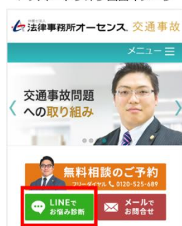
▼ スマートフォン画面イメージ