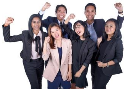
弊社のネイティブスタッフが 専門に対応します。