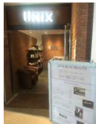
ユニックス 大宮アルシェ店

サービス名称 : ムスリマビューティ サービス開始日 : 2019 年 5 月 提供開始店舗 : ユニックス 大宮アルシェ店 住所 : 埼玉県さいたま市大宮区桜木町 2-1-1 大宮 ARCHE ビル 6F TEL : 048-631-0005 サービス内容 : ムスリムの女性を受け入れられるよう、カーテンの仕切りを設置して施術室を個室化し、接客から施術まですべて女性スタッフが対応。また、アニマルフリー・アルコールフリーのシャンプーやトリートメント、ムスリム対応のメニュー表、礼拝用マットなども用意しています。