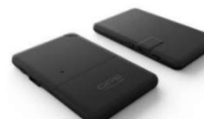
ミテテルトラッカー