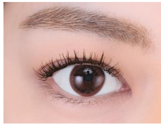
NEW! パワーオブラッシュマスカラ ロイヤルブラウン使用