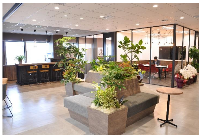
グリーンをふんだんに配置して 仕事のストレスを軽減

当社は化粧品や健康食品などのビューティ＆ヘルス領域、及び食品領域に特化したマーケティングコミットカンパニーです。自社開発・運営する「RESULT プラットフォーム」を主体に、マーケティングオートメーション（MA）システム・行動履歴、購買履歴、顧客属性などのデータマネージメントプラットフォーム（DMP）、成果報酬型アフィリエイトシステムなどを保有しています。述べ 600 社以上のダイレクトマーケティング支援のノウハウを強みとして、企業に対し、独自のテクノロジーと運用コンサルタントが【集客～販促～顧客育成】までの一貫したサービスの提案を行っています。