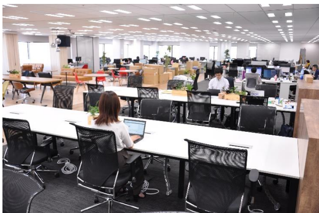
個人の机とは別に用意された自由に使えるフリーアドレス・スペース