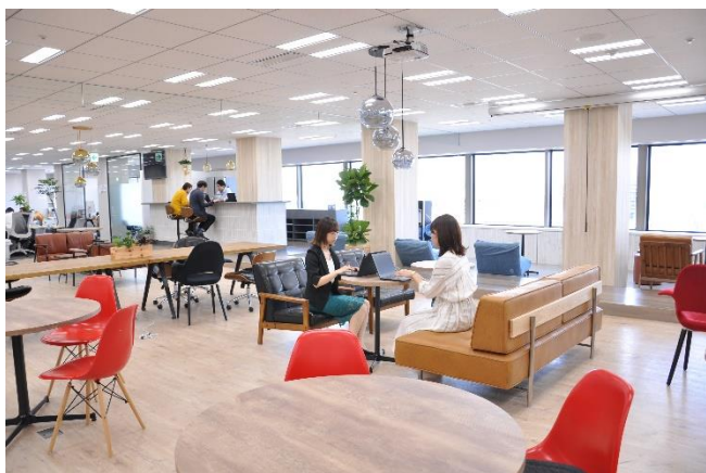
他部署と交流してイノベーションが生まれる共創空間

株式会社ピアラ（本社：東京都渋谷区、代表：飛鳥貴雄）は、事業拡大に伴う従業員増加のため、2019 年 5 月 13 日に本社を現在と同ビルの別フロアに移転いたしました。