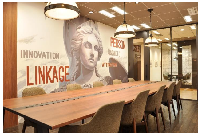
壁に PIALA の意味が描かれた会議室