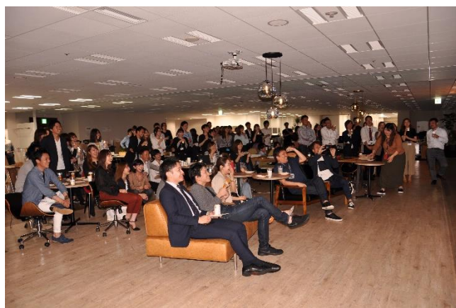
5 月 21 日に 共創空間で行われた社内交流会の様子