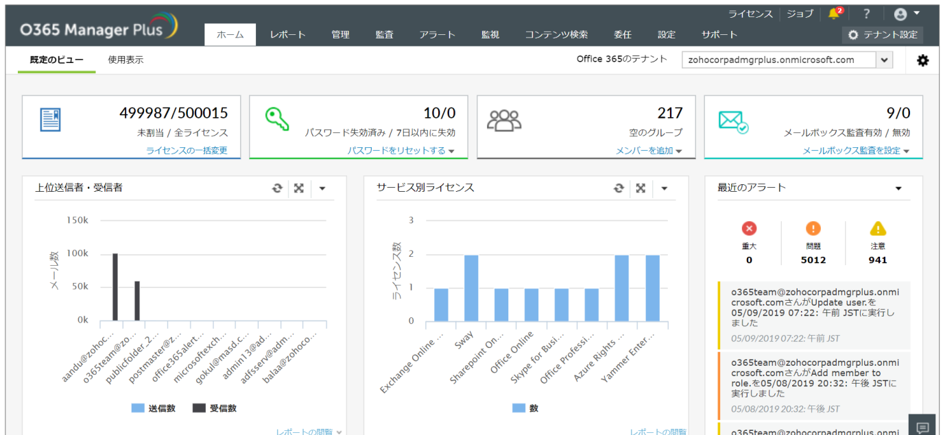
<O365 Manager Plus コンソール画面>