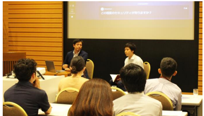
各部の後には、特別講師とインフォキュービックによるQ&Aセッションも。 参加者の皆様は終始、うなずいたりメモを取ったりして熱心に耳を傾けていました。

今回のセミナーは、大きなビジネスチャンスが眠る「中国向けインバウンドビジネス」を狙い撃ちする内容。そのため、中国からの訪日観光客の「ショッピング」「宿泊」「飲食」という3つの活動に関連する日本企業様はもちろん、中国の富裕層向けのサービスを提供する医療機関や高級寝具メーカーといった幅広い業種からも多くのマーケターの皆様に参加されました。セミナーは3部構成で、【第1部】は中国ユーザーの消費活動を支えるオンライン決済の雄「アリペイ」(Alipay)、【第2部】は「旅マエ」デジタルマーケティング施策をインフラ整備で支える「アリババクラウド」からそれぞれ特別講師を迎え、さらに【第3部】ではBaiduの基幹代理店でもあるインフォキュービックが講師を務め、中国インバウンドの「旅マエ・旅ナカ・旅アト」施策とともに中国向け「オンライン決済・デジタルインフラ・デジタルマーケティング」のエッセンスを1日で知ることができるという充実ぶり。セミナー後のアンケートでは、「中国インバウンドマーケティングで注意すべきことをさまざまな視点から知ることができ、今後の戦略に生かせそうです」等、講義内容について手応えを感じた参加者の皆様から多数の感想をお寄せいただきました。