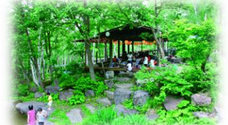
ホテルタガワ 一例