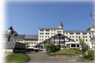
ホテルタガワ 外観