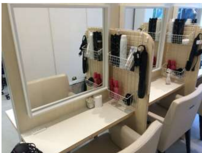
セルフドライ (ドライヤー・スタイリング剤完備)