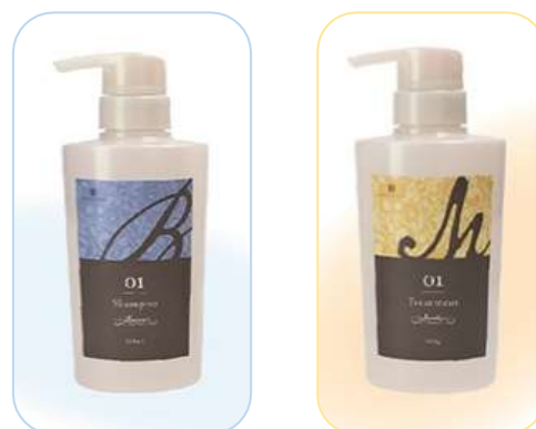
左：ユー ヘアケアプロダクツ シャンプー バウンス 3,900円（税抜）

今回新発売する『ユー ヘアケアプロダクツ シャンプー バウンス』と『ユー ヘアケアプロダクツ ヘアトリートメント モイスチャー』は、髪の悩みの2大原因である毛髪ダメージ補修と水分不足ケアにこだわったシャンプー&トリートメントです。3つの共通成分と、アイテムごとに配合した各種成分により、「ハリコシ・まとまり」感のある髪に仕上げます。みずみずしく爽やかなグリーンフローラルフルーティの香りは、まるでフレグランスのような高級感のある優しい香調です。