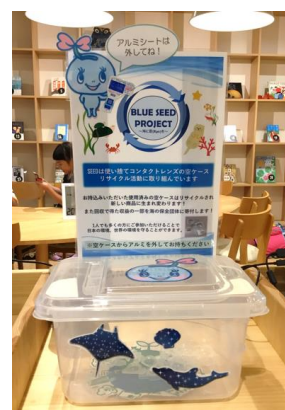
当社の廃プラ回収ボックス

概 要:当社と提携している眼科やコンタクトレンズ販売店などに回収ボックスを設置し、自社製品問わずコンタクトレンズ関連の廃棄プラスチック材を回収。収集された廃プラスチック材はヴェオリア・ジェネッツにより、物流パレットとして再製品化される。