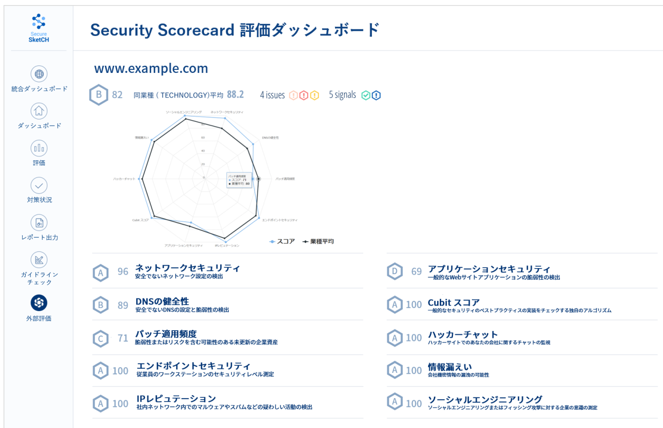
図 2：新機能「外部セキュリティスコア自動算出機能」の画面イメージ

今回加わる新機能では、担当者が設問に回答する必要はなく、外部評価の結果が点数（スコア）として自動的に算出され、毎日更新されます（図 2）。担当者は、内部評価に加えて、外部評価の結果を同一の画面で随時確認できるようになるため、セキュリティ業務のさらなる効率化・高度化が期待できます。