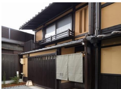
町家の面影を残した外観