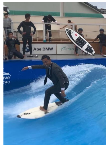
スーツ姿で顧客とサーフィン