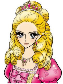
ヒロインメイク イメージキャラクター エリザベート・姫子

ヒロインメイクならではの虹彩デザインは、少女漫画のお姫様をイメージし、星とパールをあしらった繊細なデザイン。 装用後、レンズ模様は瞳の色に馴染むため、とても自然です。