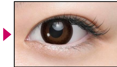
ヒロインメイク 1day UV M 装用中