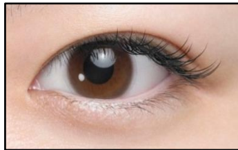
クリアコンタクトレンズ装用中

日本人の瞳の色に合ったレンズカラーを追求した、派手すぎないブラウン。 通常のブラウンにグレーを少し加えることで、より瞳を自然に際立たせます。