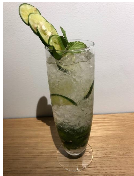
夏恋モヒート(すだち)