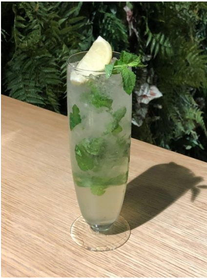
酔わせてモヒート(ライム)

オーソドックスなキューバのレシピを採用。ライムの酸っぱさと、ふんだんに使用したミントの爽快感でキリッとした味わい。