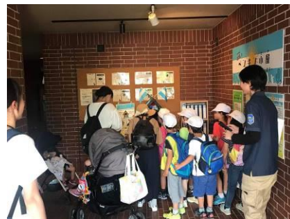
&lt;子どもたちに大人気だった様子&gt;

今回は、試験運用中に出た課題改善を踏まえ、ペンギンの自然な生態への質問を引き出しやすく、また回答がイメージしやすいよう展示方法を変えてパワーアップしています。