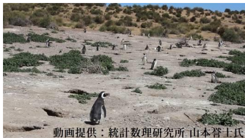
動画提供：統計数理研究所 山本啓士氏

これらの課題に対して、今回の展示では、集音しやすいようにメガホンに向かって発話する形式とし、より生態に興味・疑問を持ってもらえるよう、マゼランペンギンが自然で生きる様子を背景に展示して、質問を促すなどの工夫を加えています。ぜひご来園ください！