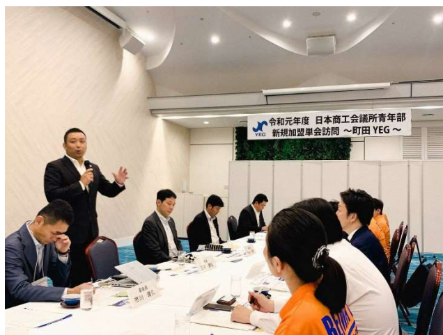
(町田YEGの説明をする三井町田YEG会長)

日本商工会議所青年部(以下日本YEG/田中暢之会長・各務原商工会議所青年部所属)は、各地の商工会議所青年部(以下YEG)が抱える悩みや、各地のさまざまな取組や事例等に関する意見交換会として、全国各地のYEGを訪問しています。