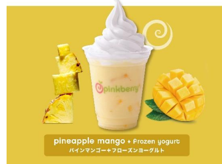
pineapple mango + Frozen yogurt パインマンゴー+フローズンヨーグルト

ピンクベリーは、爽やかな酸味と甘さのバランス良いフローズンヨーグルトと、ポップでスタイリッシュな内装、心と心のつながりを大切にする接客サービスで、高品質でフレッシュなテイストをお届けします。