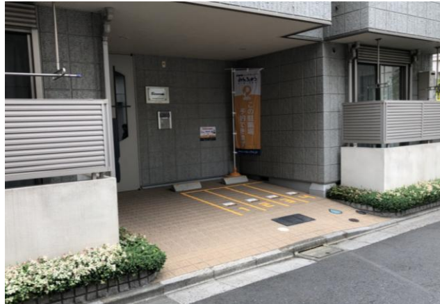
墨田区みんちゅう駐輪場①