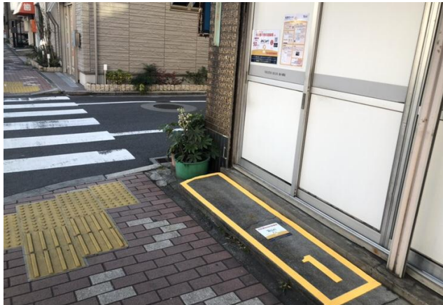
墨田区みんちゅう駐輪場②