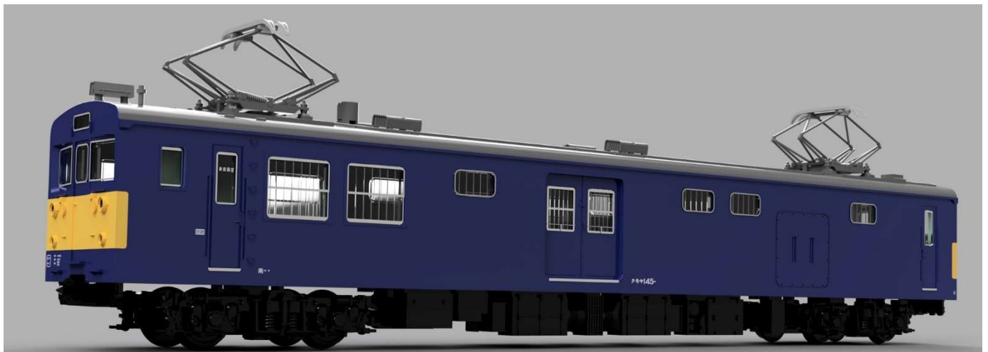
『T-Evolution クモヤ 145 形 100 番代 国鉄タイプ（H ゴム灰色）』

時計、貴金属、模型の製造・販売をおこなう株式会社天賞堂（本社：東京都中央区、代表：新本桂司）は、今秋より順次新発売する 1/80 スケールのプラスチック製ディスプレイモデル『 ディー・エボリューション T-Evolution』を、8 月 16 日～18 日に開催する「第 20 回国際鉄道模型コンベンション」にてお披露目します。